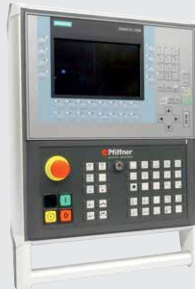
KP700 mit aktueller Maschinensteuertafel