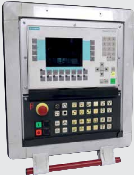
OP27 mit alter Maschinensteuertafel