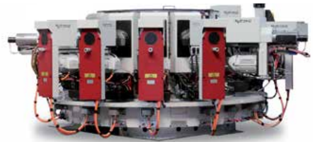
Kinematik HC Maschine